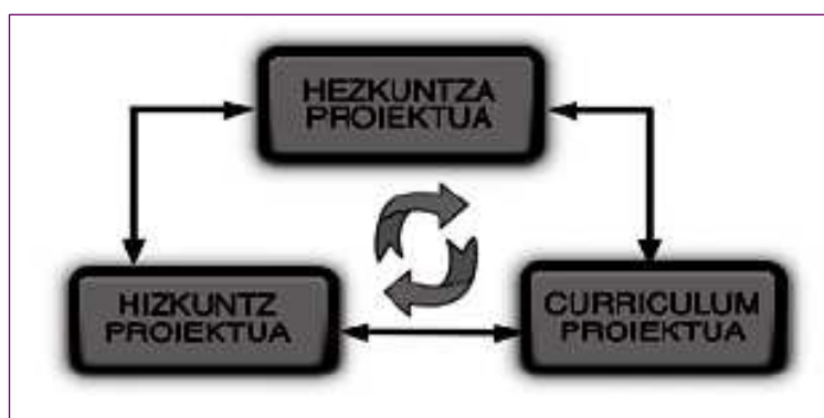
3. irudia. Hizkuntz Proiektuaren kokapena